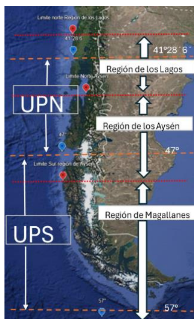
Figura 1: Mapa de composición de Unidad de Pesquería Norte (UPN), Unidad de Pesquería Sur (UPS) y Áreas de Pesca para la pesca Artesanal, distribuidas por región.

El criterio utilizado para la distribución regional de los incrementos de la fracción artesanal es consistente con lo dispuesto en el artículo primero de las disposiciones transitorias de la Ley N° 21.752, al distribuir los aumentos de la fracción artesanal conforme al artículo 48 A letra c) de la Ley General de Pesca y Acuicultura, y en coherencia con la priorización de criterios realizada por los organismos de gobernanza, siendo la distribución histórica el de mayor peso relativo en la consulta realizada, definiendo la totalidad de los incrementos de cuota para la asignación a cada región