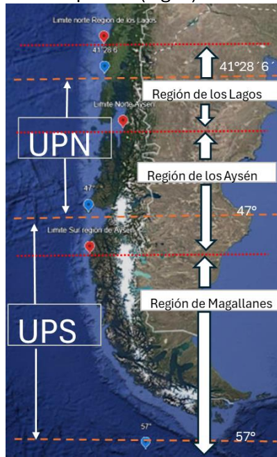
Figura 1: Mapa de composición de Unidad de Pesquería Norte (UPN), Unidad de Pesquería Sur (UPS) y Áreas de Pesca para la pesca Artesanal, distribuidas por región.

diferenciadas por región para la pesca artesanal, lo que modifica en proporciones diferentes a las Unidades de Pesquería Norte (UPN) y Unidad de Pesquería Sur (UPS), dado que la UPN, su límites superior está dentro de la región de Los Lagos y su límite inferior dentro de la región de Aysén, y por otra parte, la UPS se inicia en la región de Aysén y termina en la región de Magallanes, poseen estructuras de distribución distintas entre las áreas de pesca y la Unidades de Pesquerías (Fig. 1).