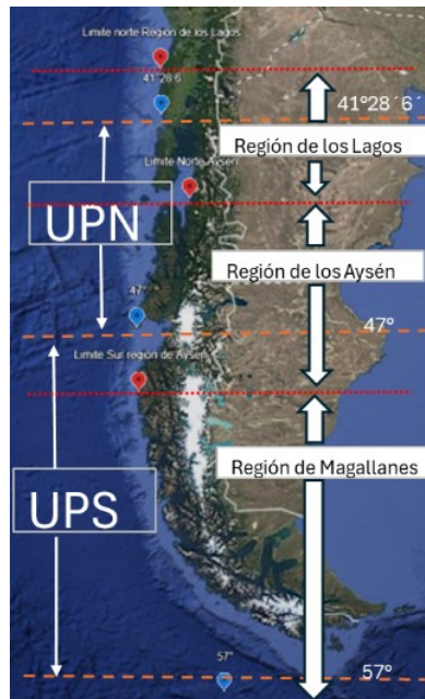
Figura 1: Mapa de composición de Unidad de Pesquería Norte (UPN), Unidad de Pesquería Sur (UPS) y Áreas de Pesca para la pesca Artesanal, distribuidas por región.

El criterio utilizado para la distribución regional de los incrementos de la fracción artesanal es consistente con lo dispuesto en el artículo primero de las disposiciones transitorias de la Ley N° 21.752, al distribuir los aumentos de la fracción artesanal conforme al artículo 48 A letra c) de la Ley General de Pesca y Acuicultura, y en coherencia con la priorización de criterios realizada por los