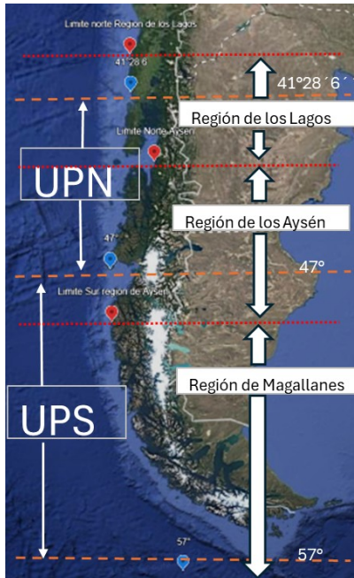
Figura 1: Mapa de composición de Unidad de Pesquería Norte (UPN), Unidad de Pesquería Sur (UPS) y Áreas de Pesca para la pesca Artesanal, distribuidas por región.

Justificación de la elección del estadístico (Mediana) y cálculo del Coficiente de Participación Regional (CPR) para el nuevo Stock Único de Congrio Dorado para la Pesca Artesanal en las áreas de pesca: