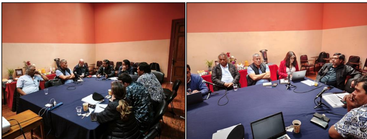
Registro fotográfico al inicio de la sesión (izquierda) y durante la presentación de las y los profesionales de SII (derecha).