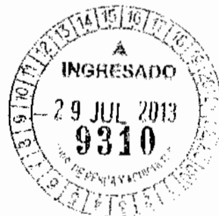
RICARDO PROVOSTE ACEVEDO Contralor Regional Valparaíso CONTRALORÍA GENERAL DE LA REPÚBLICA